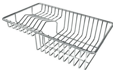
GRILLE POR.ASSIETTES INOX mm214x379