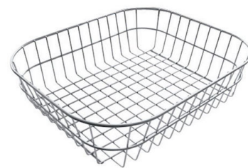
PANIER INOX POUR CUVE 34x40 CM

* uniquement en combinaison avec l'accessoire A644 A01