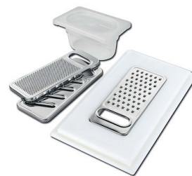
KIT RÂPES ET PLANCHE DE DECOUPE HDPE