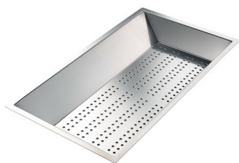
CUVETTE INOX PERFOREE