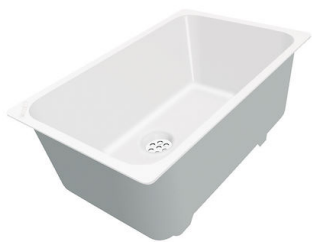
CUVETTE PLASTIQUE BLANCHE A153 A00