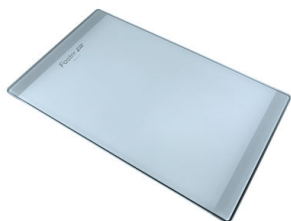
PLANCHE DE DECOUPE CRYSTAL 23x41 CM